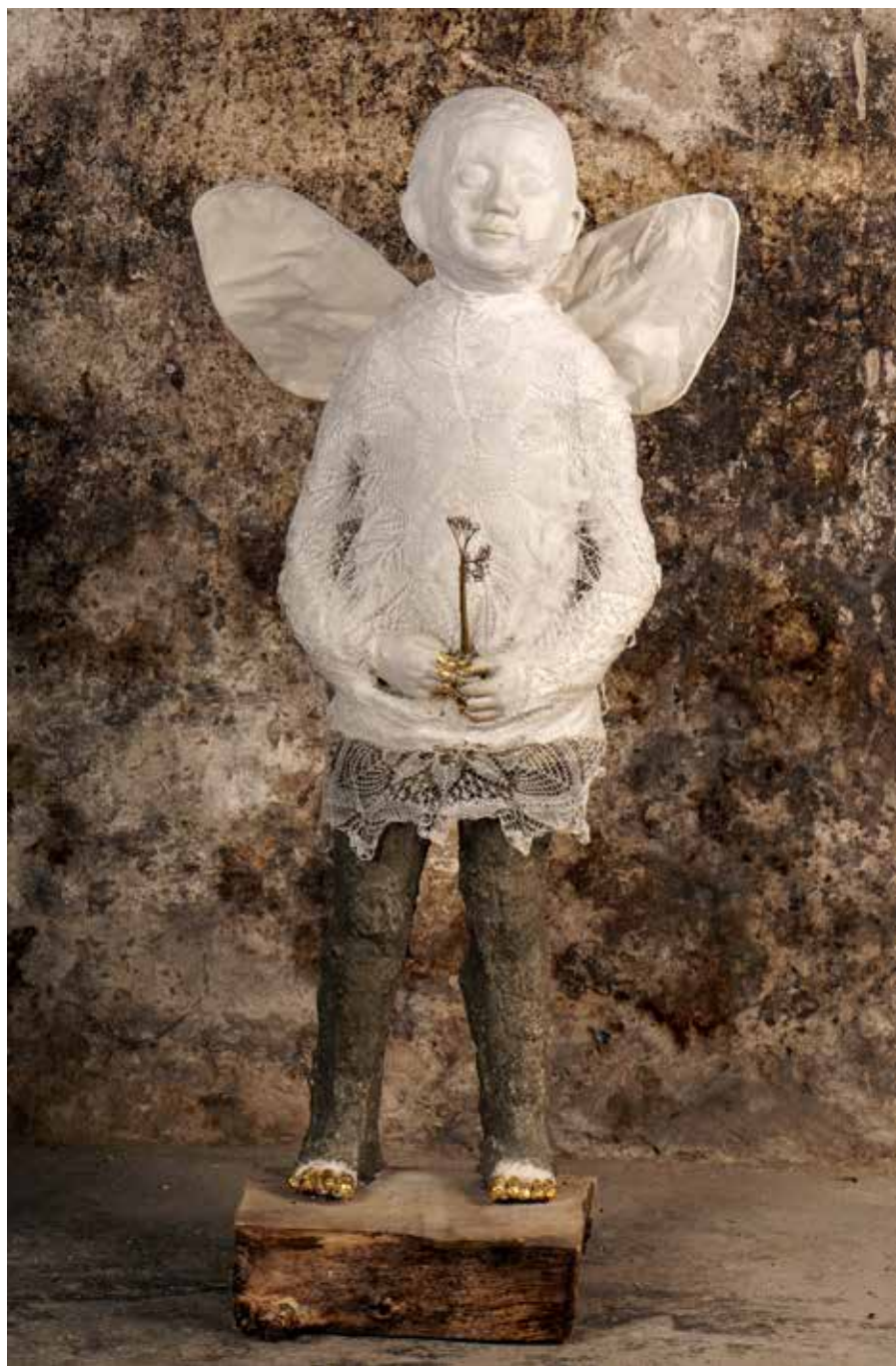
Nevidno vidno, Iva, 2019, mešana tehnika, 50 x 30 x 110 cm