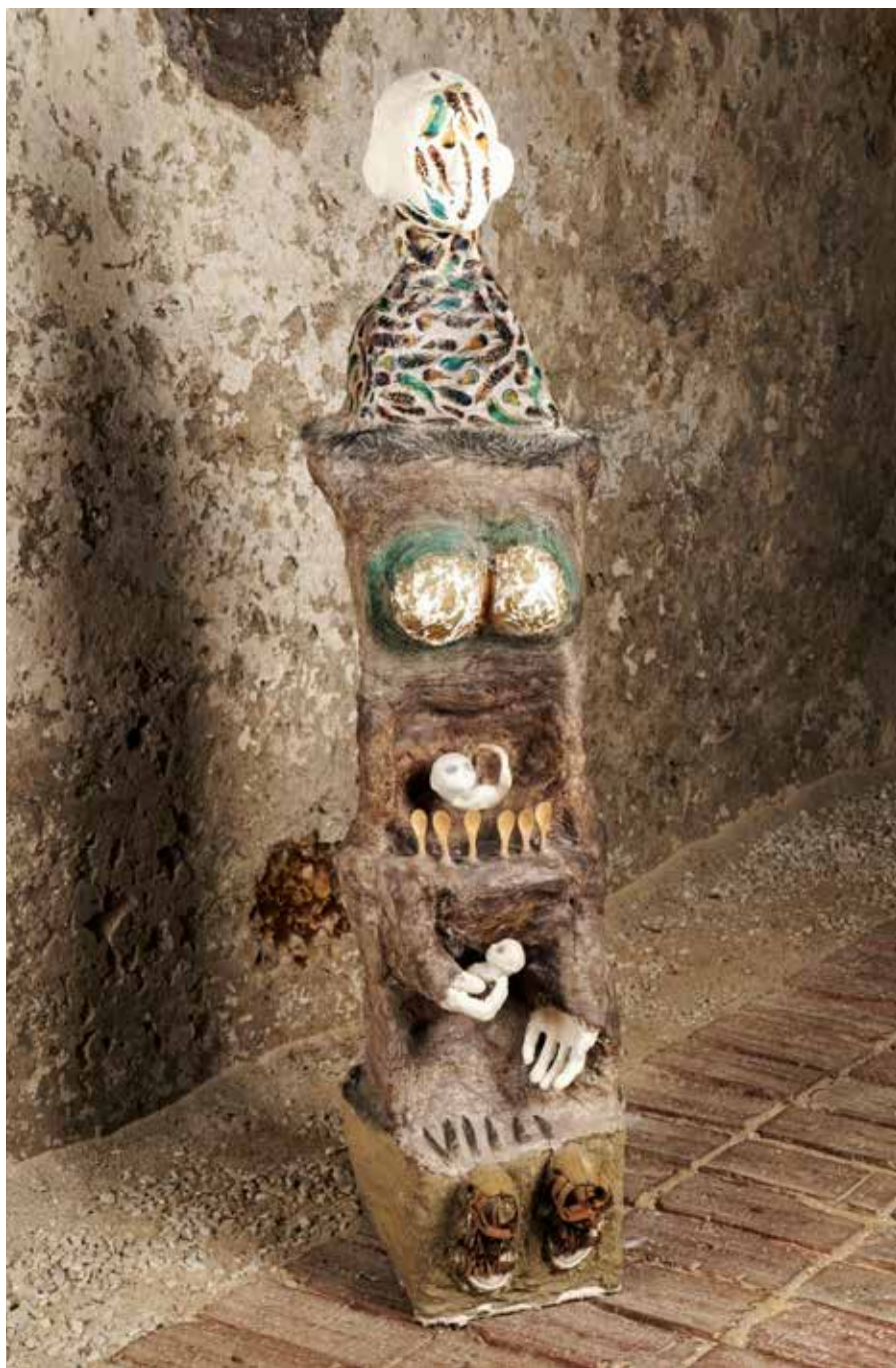
Nevidno vidno, Tanja, 2019, mešana tehnika, kolaž, 28 x 37 x 160 cm